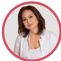
Nargis Valijanovna Yurmatova IVF Clinic +1 Interstar