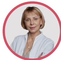
Olga Sergeevna Gorskaya IVF Clinic +1 Interstar