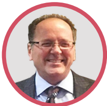
凯文·杜迪 美国辅助生殖技术协会 (SART) 主席