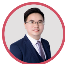
米 云 双米健康双米健康