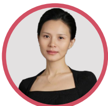
金 晓 美国 Pure Polar 孕慈安中国代表