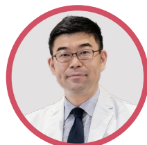
小川 誠司 日本小川优生医学中 (Tokyo ART Clinic) 院长、 日本藤田医科大学生殖中心、 主任医生, 教授