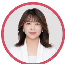
Summer 美国 FSAC 加州生殖中心 国际医疗负责人